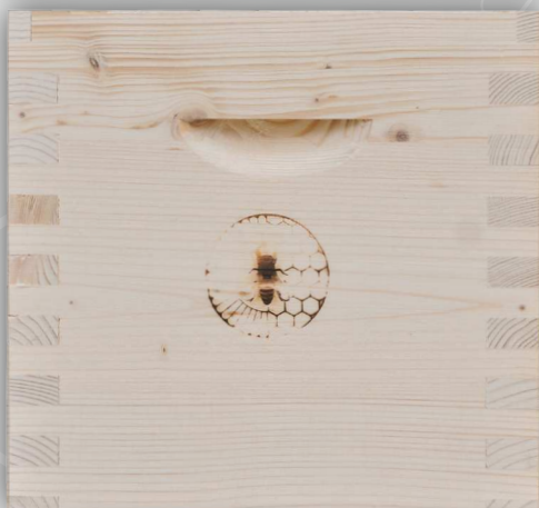
Vollzarge oder Flachzarge